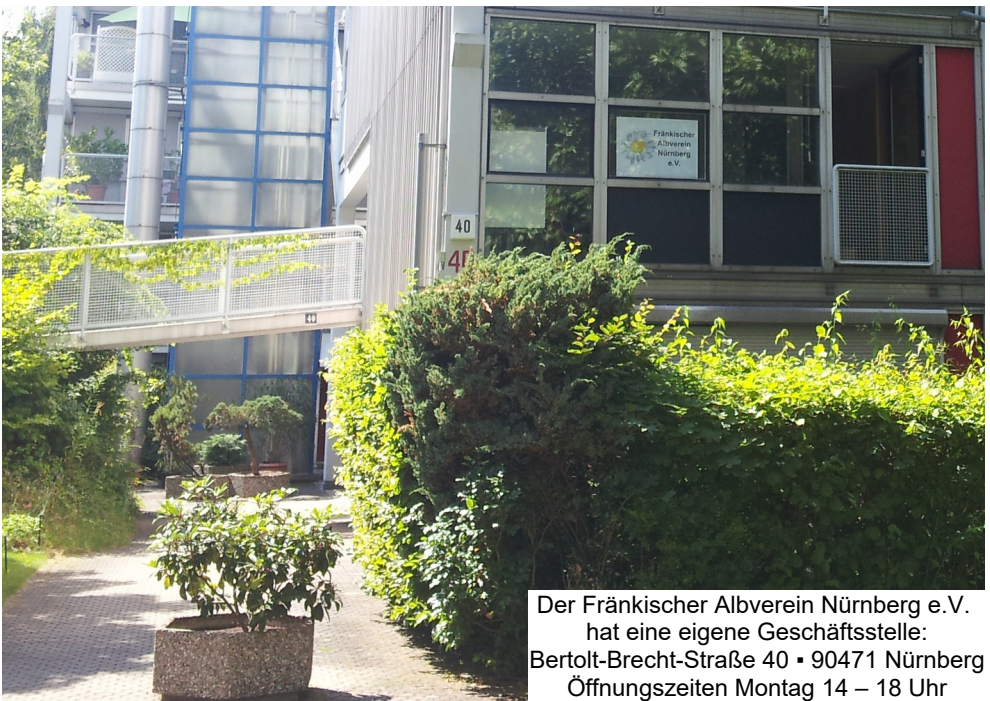
Der Fränkischer Albverein Nürnberg e.V. hat eine eigene Geschäftsstelle: Bertold-Brecht-Straße 40 • 90471 Nürnberg Öffnungszeiten Montag 14 – 18 Uhr